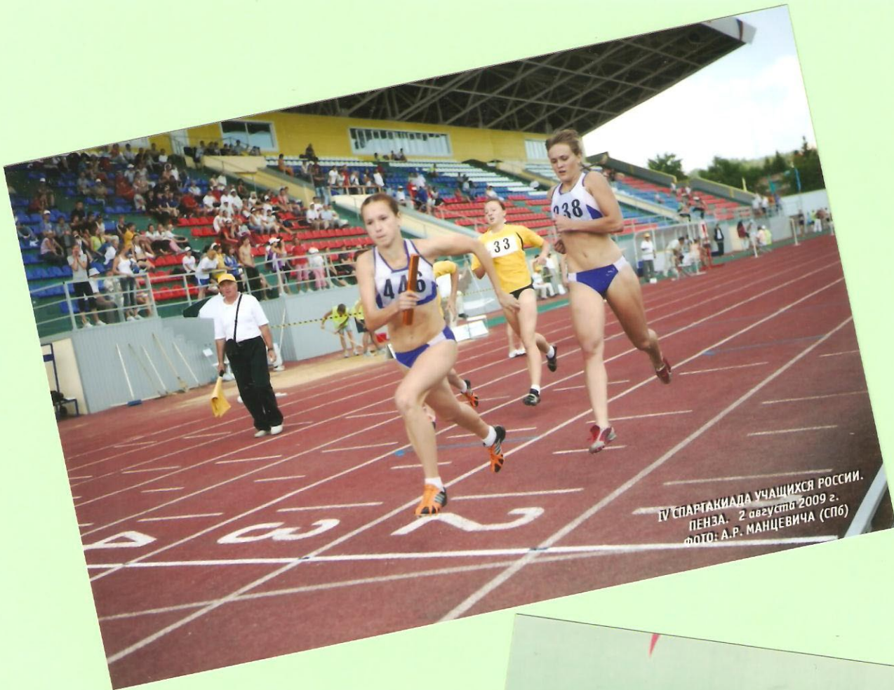
IV СПАРТАКИАДА УЧАЩИХСЯ РОССИИ. ПЕНЗА. 2 августа 2009 г.