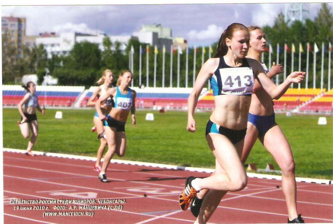
ПЕРВЕНСТВО РОССИИ СРЕДИ ЮНИОРОВ. ЧЕБОКСАРЫ. 19 июня 2010 г.

Удачный старт на первенстве России среди юниоров и путевка на Чемпионат мира среди юниоров.